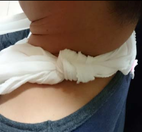
步驟三：繞過後頸於健側肩膀處平結收尾